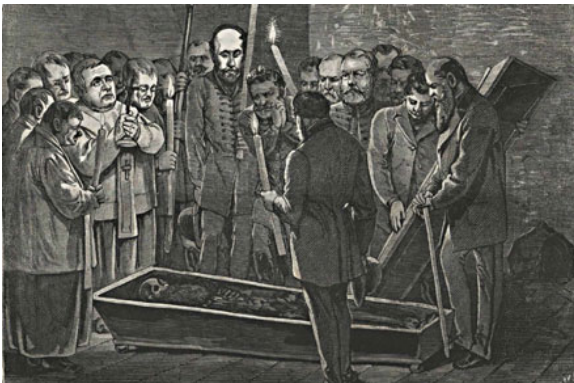
Batthyány holttestének azonosítása, 1870. március 29.

http://mult-kor.hu/cikk.php?id=17592&pIdx=2&print=1