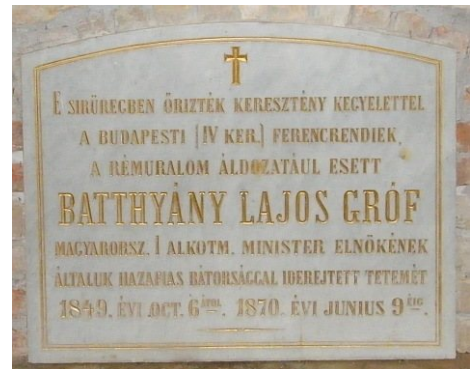
Az új tábla, ami kívül helyezkedik el a sírfalon

Belvárosi (Pesti) Ferences Templom Egy előfal készült a 2007-es Batthyány emlékév során, mely lehetővé teszi az eredeti sír tábla és az új tábla láthatóságát. Batthyány alul a középső sírban nyugodott 21 évig.